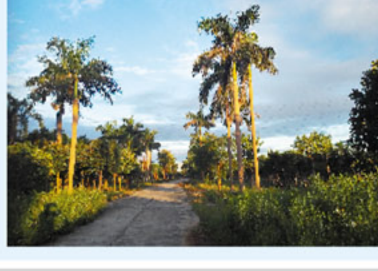
▲清晨阳光幸福