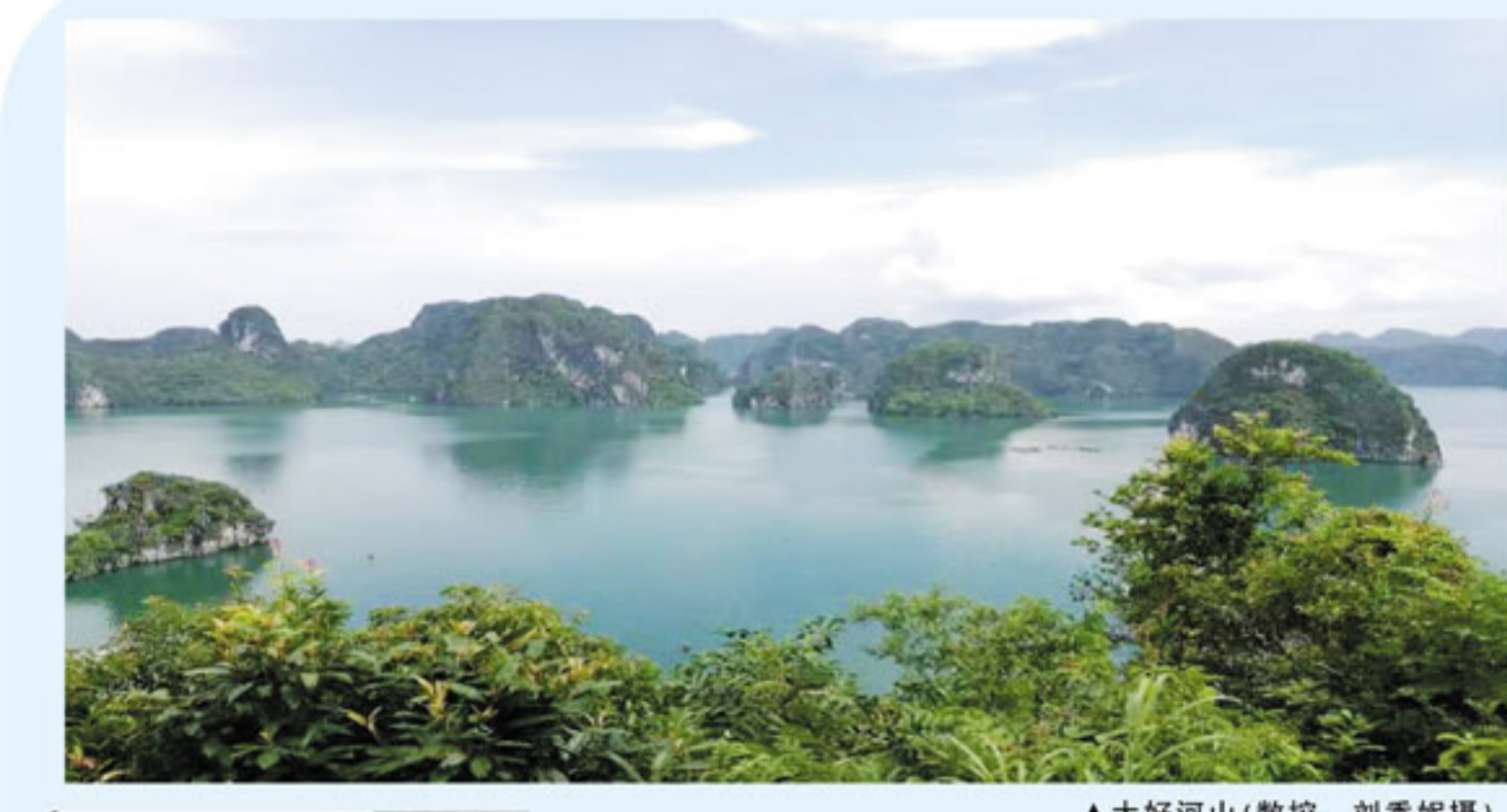
▲大好河山

最开心的当然是在晚上,全家人一起吃晚饭,端出月饼,切开一起品尝,当然还有香蕉、葡萄、哈密瓜、柚子等五光十色的水果,让人垂涎欲滴。到了再晚一些,我们还吃了一些小食,像炒田螺、小芋头、汤圆等。但我的心思早就不再这些美食上了,我随便吃了几口小食,就提着灯笼,去找小时的同伴了。妈妈说她小时候玩的灯笼是用纸和竹条扎成的,有水果的、鸟兽的、鱼虫的形状,里面点着蜡烛,用绳子系在竹竿上,将竹竿放在高处,所以叫“树中秋”。我们现在玩的灯笼先进多了,虽然很方便,但却少了一种传统的味道。这时只见月亮时而含羞地躲在云层里,时而大大方方地露出笑脸,跟我们的灯笼争相辉映,而这美好的中秋夜也让人忘记时间的流失!(泰华 李辉)