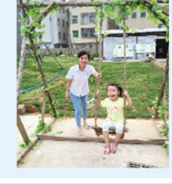
▲童声笑语