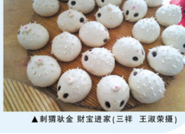
▲刺猬驮金 财宝进家